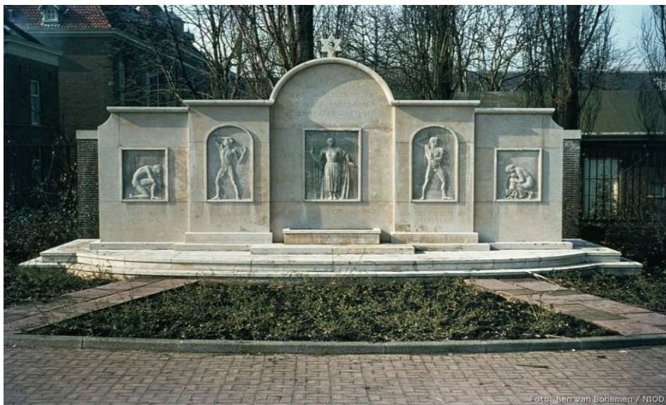
Slika 1. J. G. Wertheim, Spomenik židovske zahvalnosti, ( Jewish Gratitude Monument ), Amsterdam, 1950.